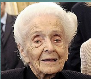
RITA LEVI- MONTALCINI